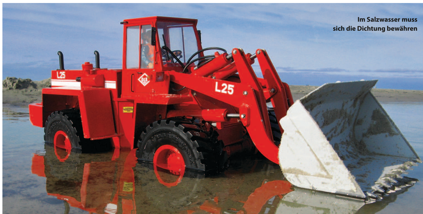
Im Salzwasser muss sich die Dichtung bewähren

Dichtungen leben vom geschmiert sein. Bei der Konstruktion ist darauf zu achten, dass mein abzudichtender Raum nicht voll Öl, wie bei Getrieben oder Hydraulikzylindern ist, bei denen der Leckölstrom automatisch die Dichtung feucht hält. Daher müssen sie für gelegentliche Wartung leicht zugänglich, aber nicht direkt dem Dreck ausgesetzt sein.