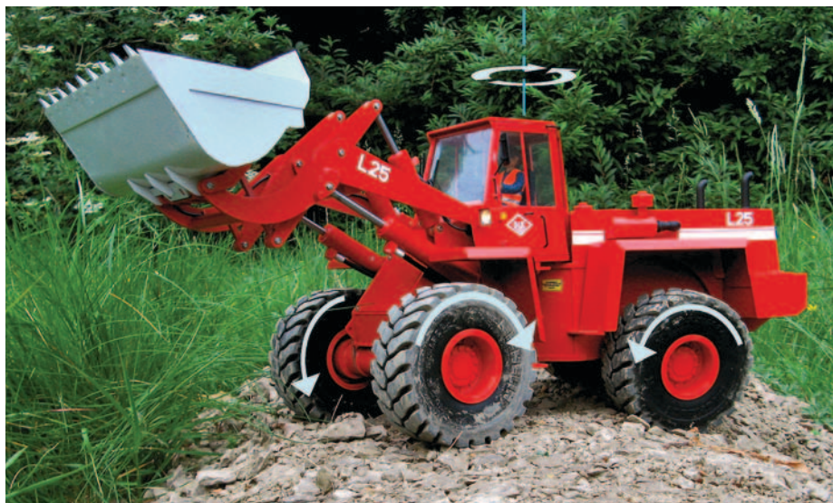
Unterschiedliche Drehrichtung der Räder beim Wendemanöver im Stand

Geräusche von lauten Getrieben dürfen auf gar keinen Fall auftreten. Auch wenn die sensationelle Soundakustik meines L25 die störenden Getriebegeräusche übertönen könnte.