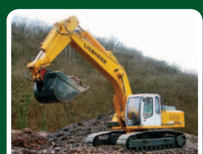
Kettenbagger Liebherr 934 in 1:8