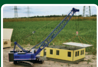
Raupenkran Liebherr HS 853HD in 1:14,5