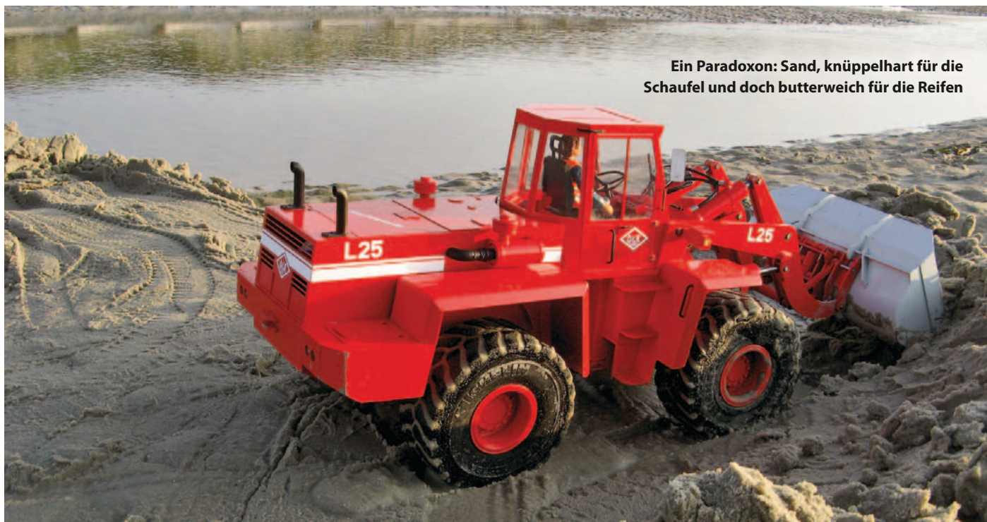
Ein Paradoxon: Sand, knüppelhart für die Schaufel und doch butterweich für die Reifen

Das Radnabenmotorkonzept ist nun schon fast an der Serienschaltung gescheitert. Des-