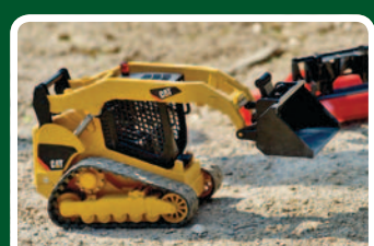
CAT-Deltalader aus einem Bruder-Modell