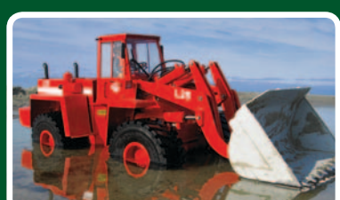
Antriebskonzept für einen Radlader