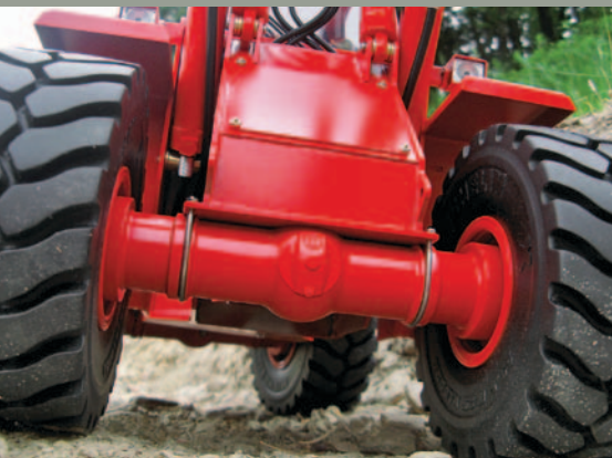
Eine schlanke Achse schmeichelt dem Auge

Bevor ich einen Gedanken auf das Antriebskonzept meines Radladers L25 von Orenstein & Koppel aus dem Jahr 1976 verwendete, wurden der Maßstab und somit die Baugröße definiert. Der ausführliche Bericht „Konstruktionsprinzipien“ in der Zeitschrift „CNC im Modellbau 1/2011“, ist dieser ersten grundlegenden Entscheidung gewidmet.